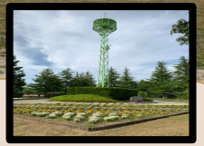
町のシンボル愛の鐘

長命ヶ丘では町内会・商店会・おやじの会・子ども育成会が一丸となり、地域の行事「学校に泊まろう」「長命ヶ丘夏祭り」「スポーツフェスタ」「地域合同防災訓練」等を行ってきました。