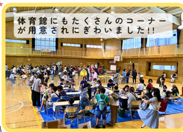
体育館にもたくさんのコーナーが用意されにぎわいました!!