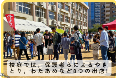
校庭では、保護者らによるやきとり、わたあめなど8つの出店!